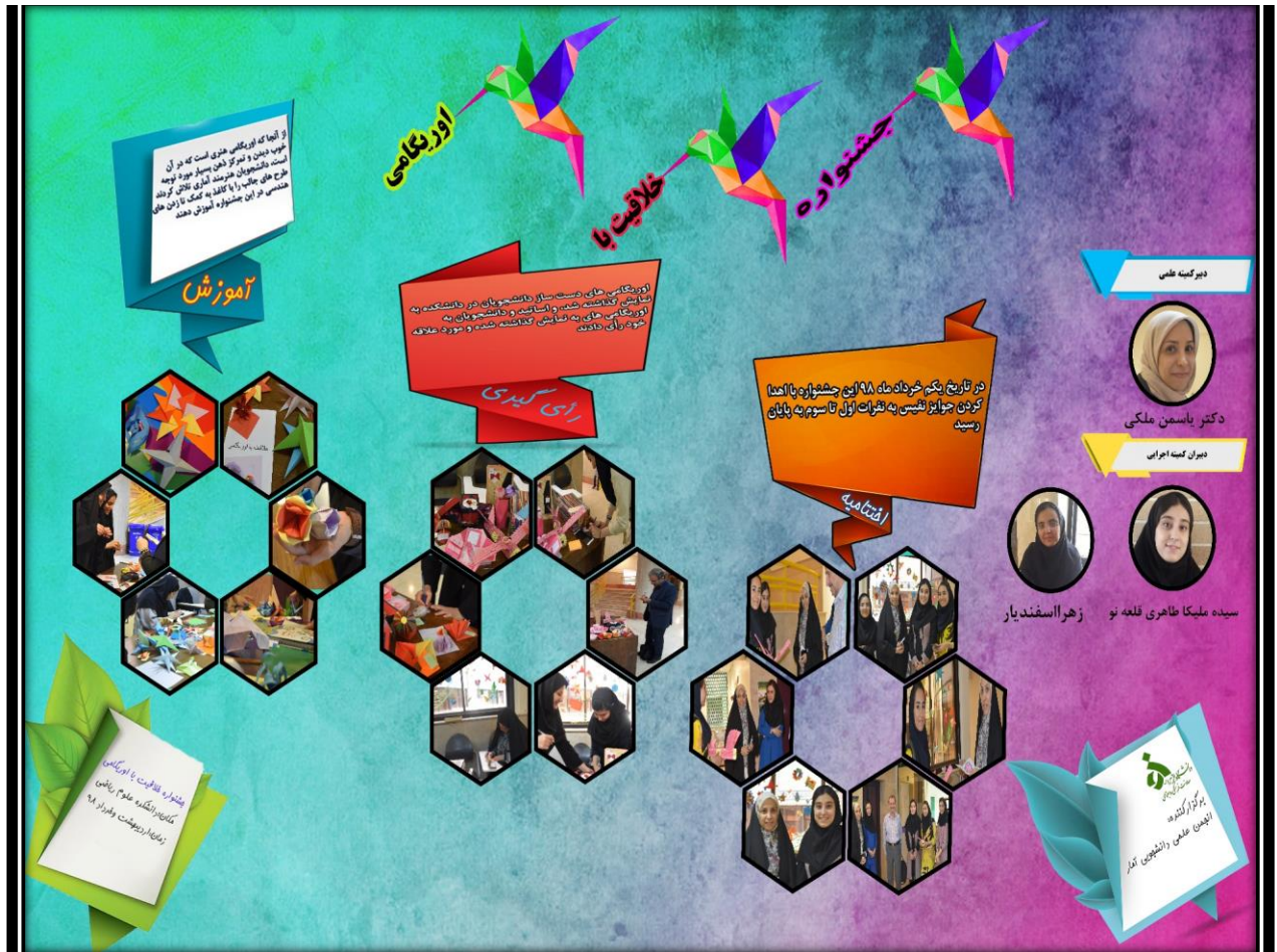
اینفوگرافی جشنواره خلاقیت با اورنگامی جهت شرکت در جشنواره حرکت