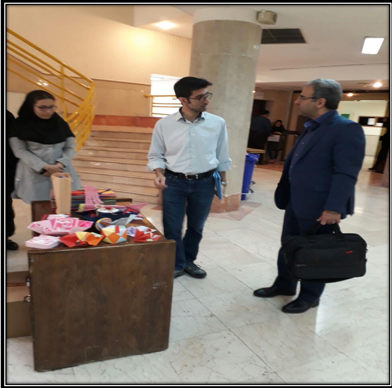
حضور دکتر ایزدی و دکتر خانتیموری دو تن از استاتید گروه علوم کامپیوتر در رای گیری