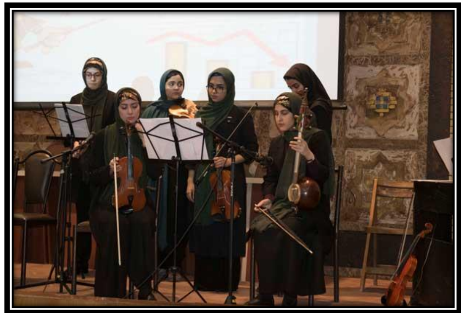
• اجرای موسیقی توسط دانشجویان الزهرا(س)