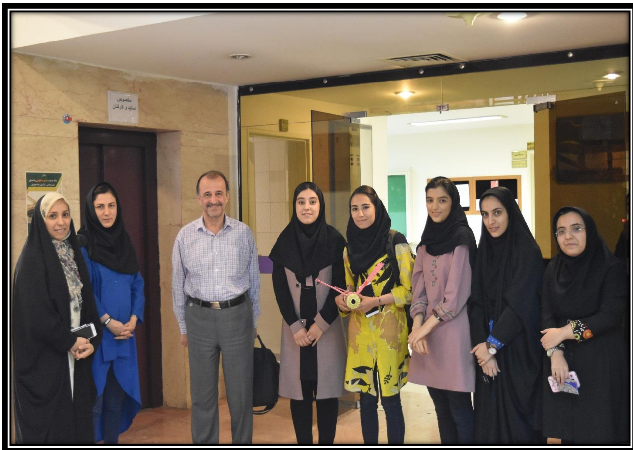
حضور پروفیسور پارسیان عزیز در مراسم اختتامیہ